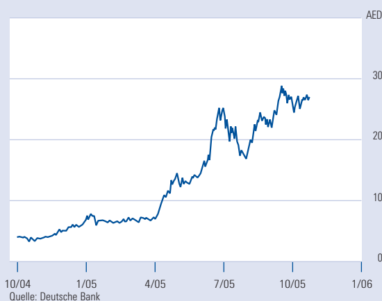
Kursentwicklung Emaar Properties

Für das erste Halbjahr 2005 kann Emaar Properties mit glänzenden Zahlen aufwarten: bei einem Anstieg der Umsätze von 94 Prozent auf 1,28 Milliarden US-Dollar konnte ein Gewinn von 690 Millionen US-Dollar erwirtschaftet werden. In den vergangenen fünf Jahren hat Emaar Properties mit weiteren Bauunternehmen Projekte im Gesamtwert von mehr als 20 Milliarden US-Dollar in der Region angekündigt. Experten rechnen damit, dass es ein Jahrzehnt dauern wird, bis die derzeitigen Bauprojekte abgeschlossen sein werden, wodurch Emaar Properties gesicherte Einkünfte über die nächsten Jahre erzielen könnte.