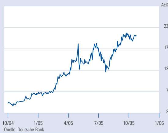
Kursentwicklung Dubai Investments Comp.

Das 1995 gegründete Unternehmen hat es in seiner zehnjährigen Geschichte an die Spitze der Investitionsgesellschaften in den Vereinigten Arabischen Emiraten geschafft. Die Dubai Investments Company ist die größte Beteiligungsgesellschaft, die an der UAE Stock Exchange gelistet ist. Der Fokus der Investitionen liegt vorrangig auf Unternehmen aus den Vereinigten Arabischen Emiraten